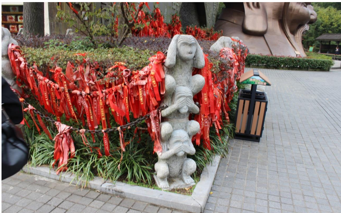
山顶上设有二个景区，分别是吴越观景区和历史文化区。